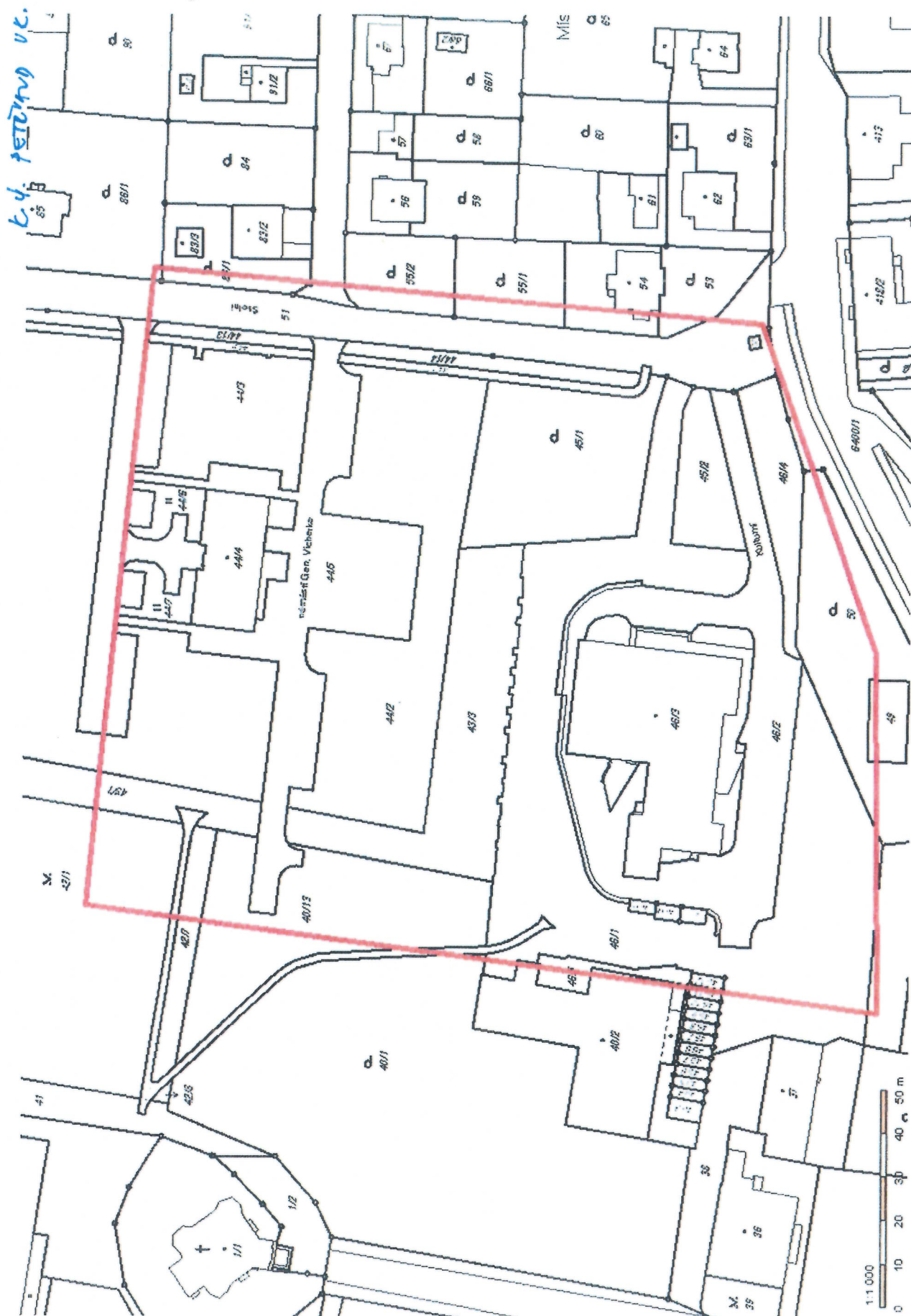
Příloha č. 1: Situace zájmového území